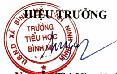
Nguyễn Thị Kim Ngân